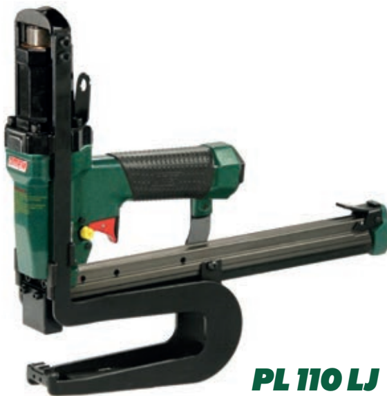
PL 110 LJ