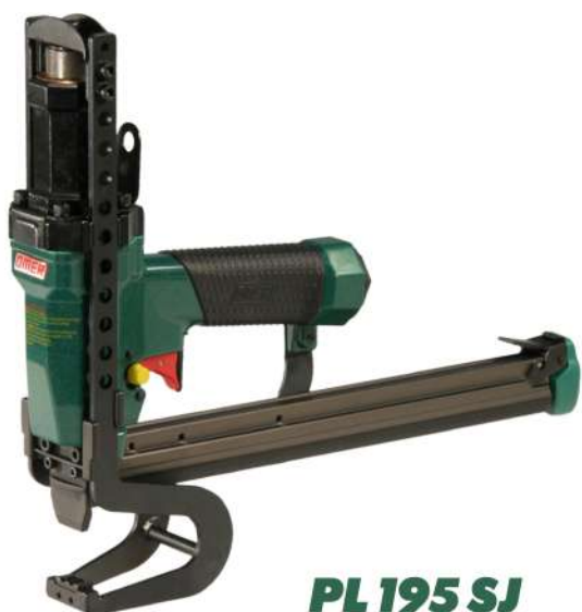
PL 195 SJ