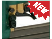
Versione SL VL SL VL model