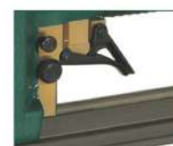
Versione V - V model