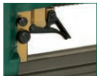
Versione V - V model