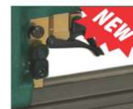
Versione SL VL SL VL model