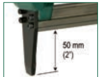
Versione SL - SL model