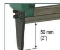
Versione SL - SL model