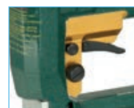
Versione V - V model