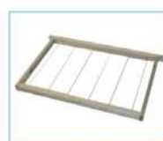
Telai apicoltura Hive frames