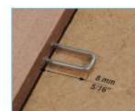
Costruzione cornici Picture frame manufacture