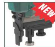
Versione D - D model