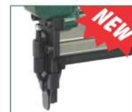
Versione BDA - BDA model