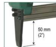
Versione SL - SL model