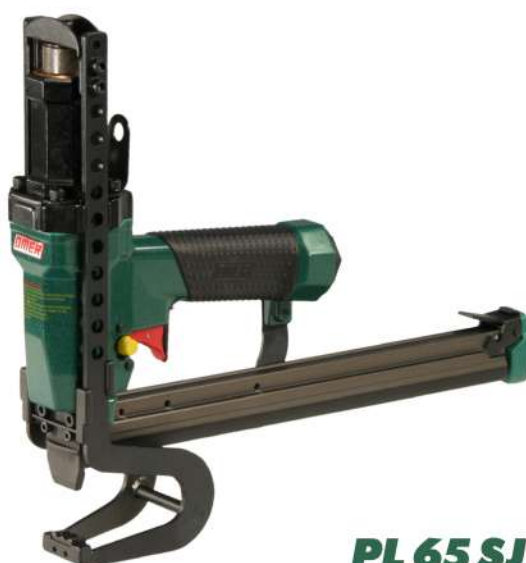
PL 65 SJ