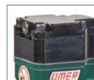
Versione V - V model