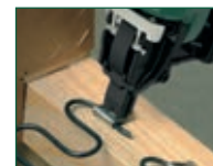
Versione CNO-SAG CNO-SAG model