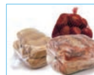
Chiusura sacchetti Polypropylene bag closing