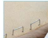
Manifattura pellicce Fur dressing