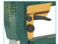
Versione V - V model