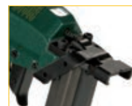
Versione S - S model