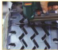
Ricopertura pneumatici Tyre retreading