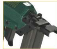
Versione S - S model