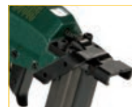
Versione S - S model