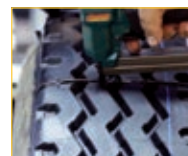
Ricopertura pneumatici Tyre retreading