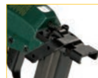
Versione S - S model