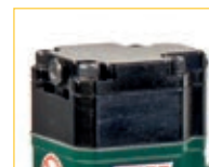
Versione V - V model