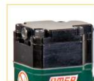
Versione V - V model