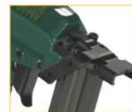
Versione S - S model