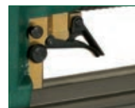
Versione V - V model