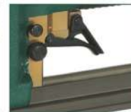
Versione V - V model