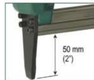
Versione SL - SL model