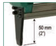
Versione SL - SL model