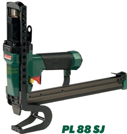
PL 88 SJ