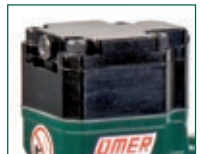
Versione V - V model