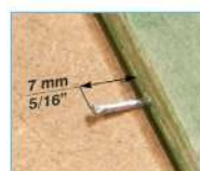
Costruzione cornici Picture frame manufacture