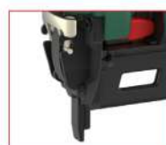
Versione NS - NS model