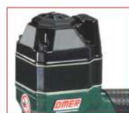
Versione A - A model