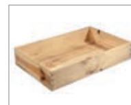
Costruzione cassette Wooden cases production