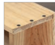
Costruzione cassette Wooden cases production