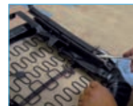
Costruzione sedili Seat manufacture