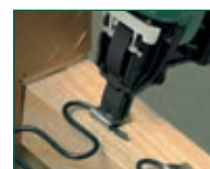
Versione NO-SAG NO-SAG model