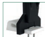
Versione 104 (Fissaggio clip) 104 version (Clip Fixing)