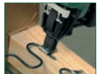
Versione NO-SAG NO-SAG model