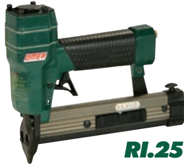
RI.25 - RI.28