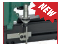
Sensore a richiesta Sensor on request