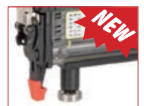
Versione D - D model