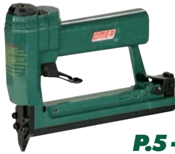
P.5 - P.7