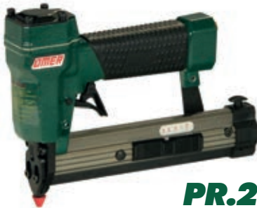
PR.28 - PR.30