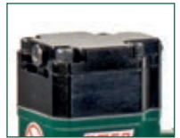
Versione V - V model