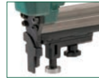
Versione D - D model