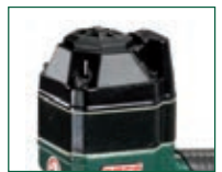
Versione A - A model