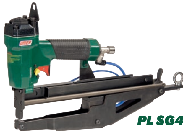
PL SG44 PJ