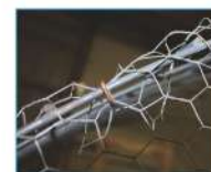
Costruzione gabbie Cage manufacture