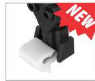
Versione 104 (Fissaggio clip) 104 version (Clip Fixing)