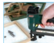
Costruzione cornici Picture frame manufacture