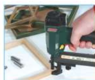
Costruzione cornici Picture frame manufacture