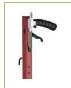
Versione CP - CP model