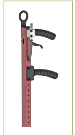
Versione CP1 - CP1 model