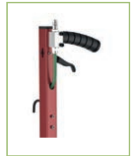
Versione CP - CP model