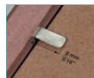
Costruzione cornici Picture frame manufacture