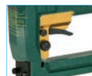
Versione V - V model